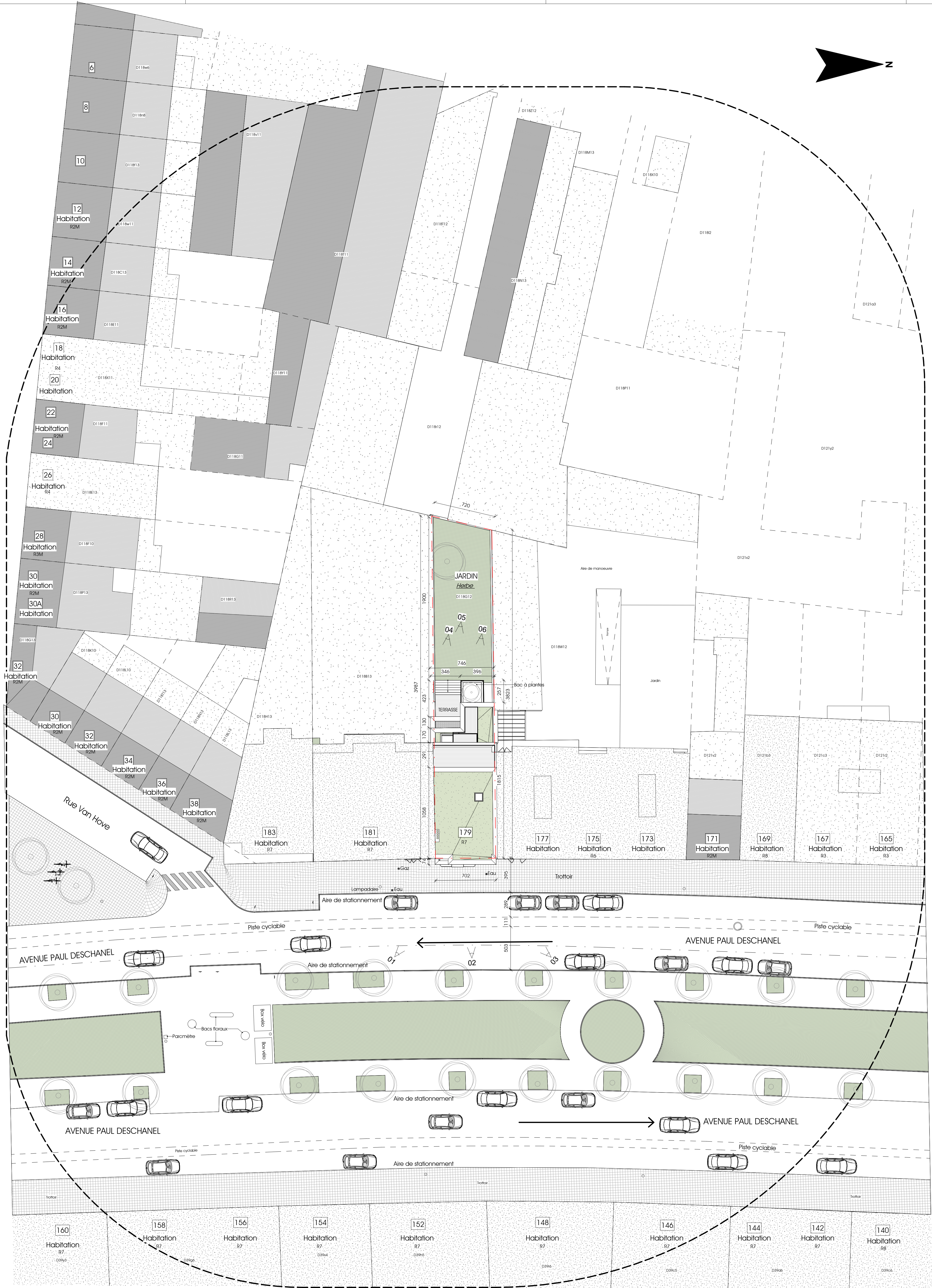
Projetée - Plan d'implantation 1 : 200